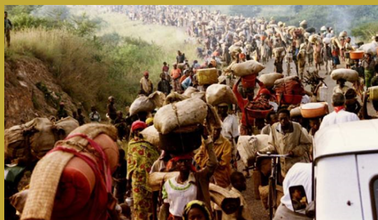
(masový útek z Rwandy 1994)

Po víťazstve OSN a Tutsiov utiekli do dnešného Konga a Tanzánie milióny Hutuov, mnohí sa ale vrátili v anonymite, spolu s nimi aj organizátori masakru. Medzinárodný tribunál odsúdil Theonesta Bagosoru na doživotné väzenie a ďalších takmer 2 mil. ľudí uznal vinnými z riadenia a podieľania sa na vraždení.